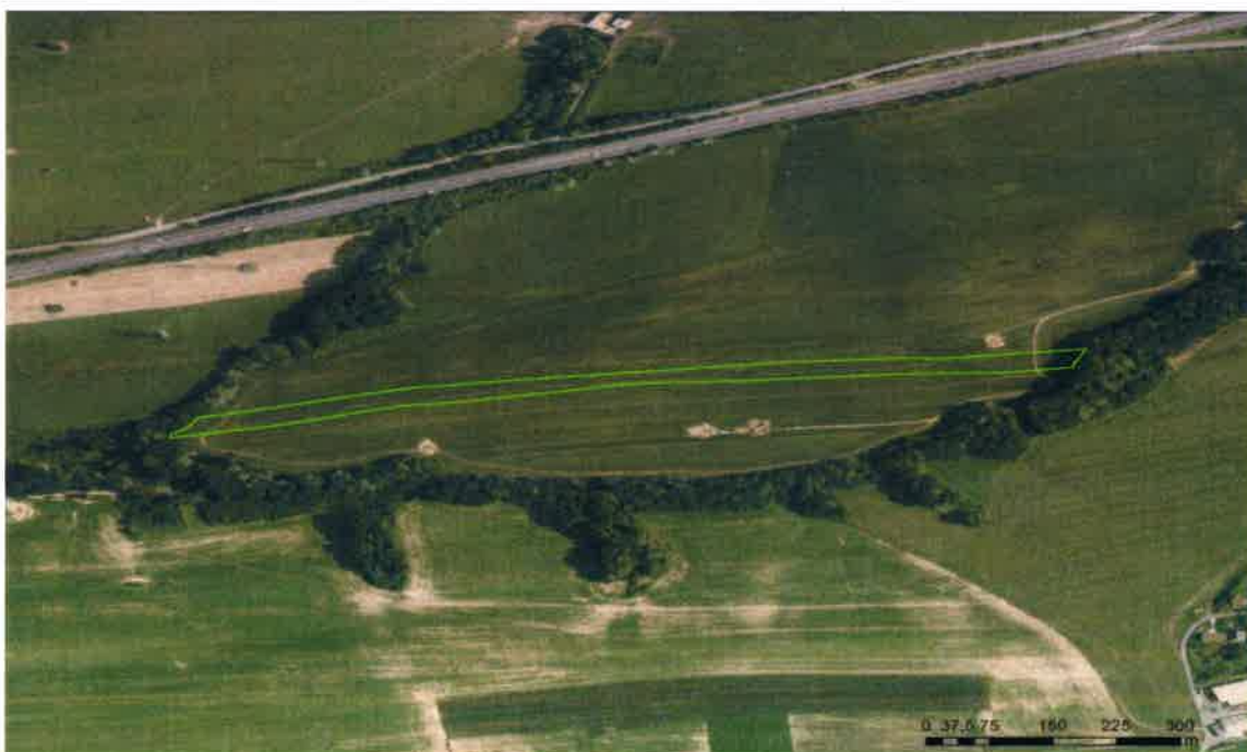
Obr. 2: Aktuální ortofoto bez dřevin (podkladová data: ČÚZK, https://geoportal.gov.cz )