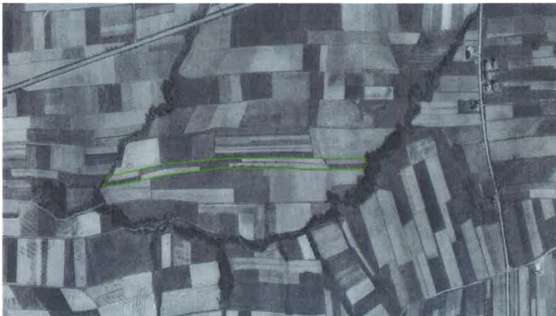
Obr. 1: Ortofoto z 50. let 20. století (podkladová data: https://geoportal.gov.cz ) zeleně vyznačeny pozemky současného vlastníka Města Příbor s dřevinami uprostřed