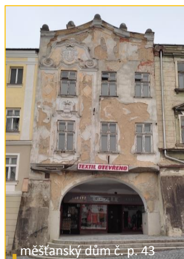
měšťanský dům č. p. 43