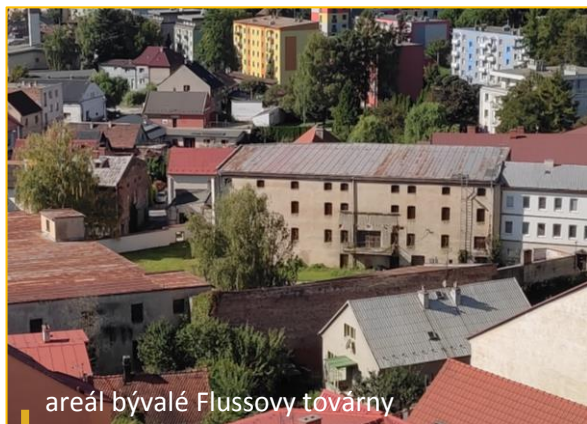
areál bývalé Flussovy továrny