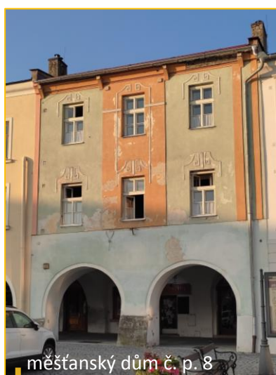
měšťanský dům č. p. 8