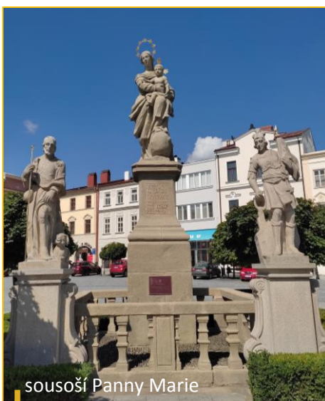
sousoší Panny Marie