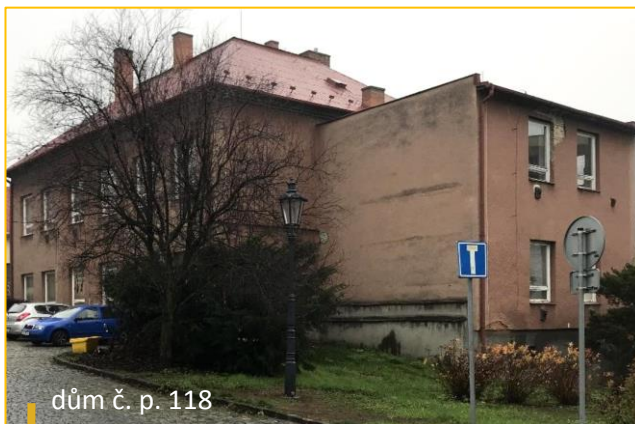
dům č. p. 118