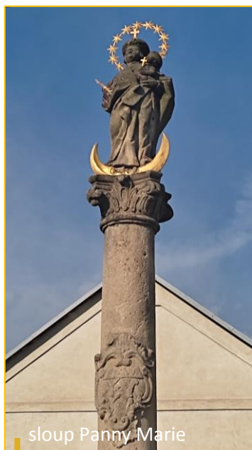
sloup Panny Marie