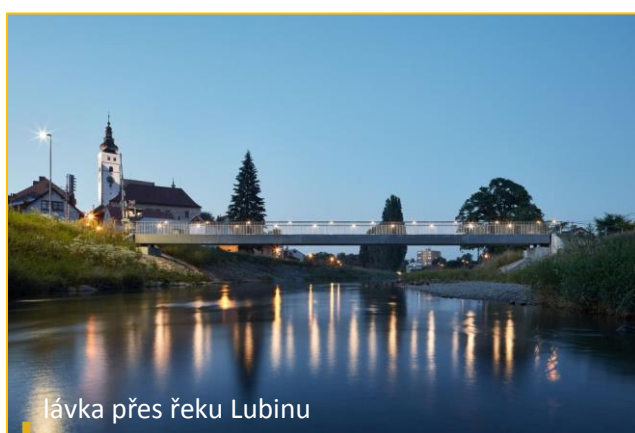
lávka přes řeku Lubinu