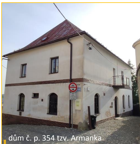
dům č. p. 354 tzv. Armanka