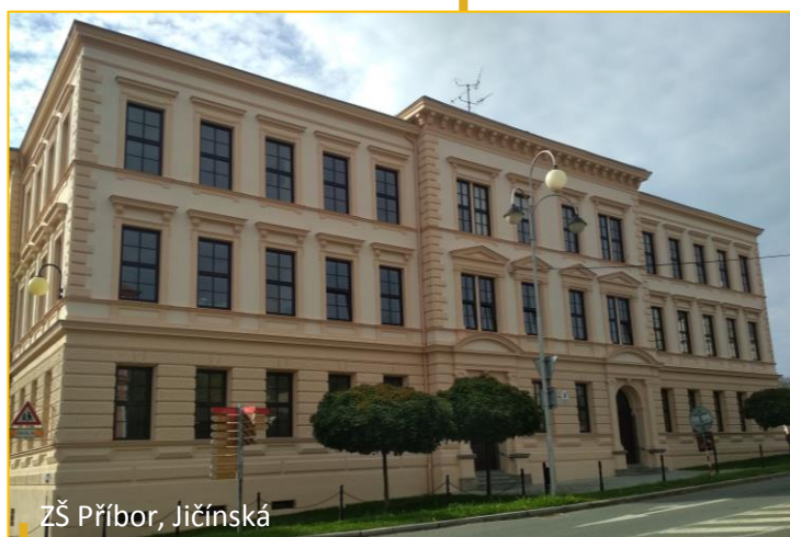
ZŠ Příbor, Jičínská