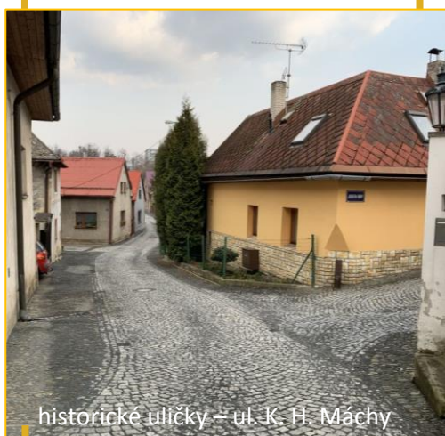
historické uličky – ul. K. H. Máchy