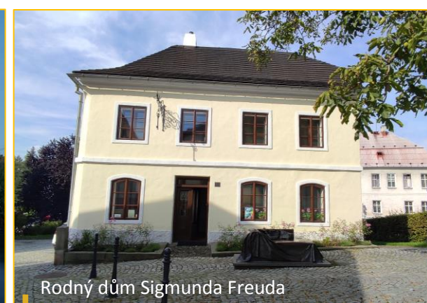
Rodný dům Sigmunda Freuda

Následující údaje dokumentují příklad finanční účasti města Příbora na obnově památkových objektů spolu s podílem státu v letech 2018–2022.