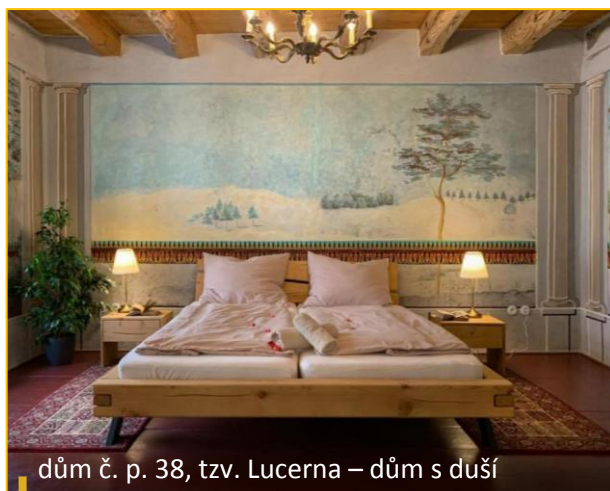
dům č. p. 38, tzv. Lucerna – dům s duší