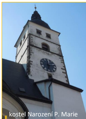
kostel Narození P. Marie