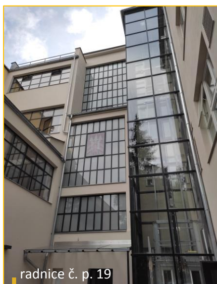
radnice č. p. 19