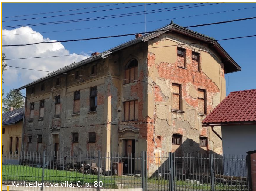
Karlsederova vila, č. p. 80