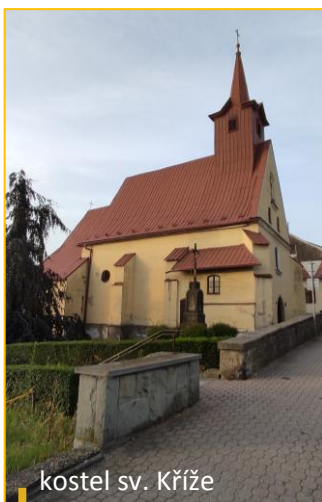
kostel sv. Kříže