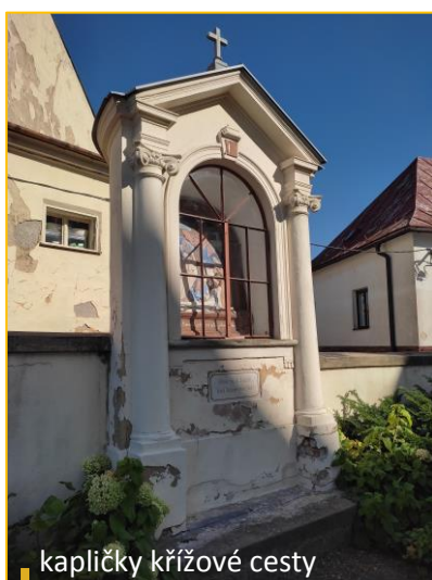
kapličky křížové cesty